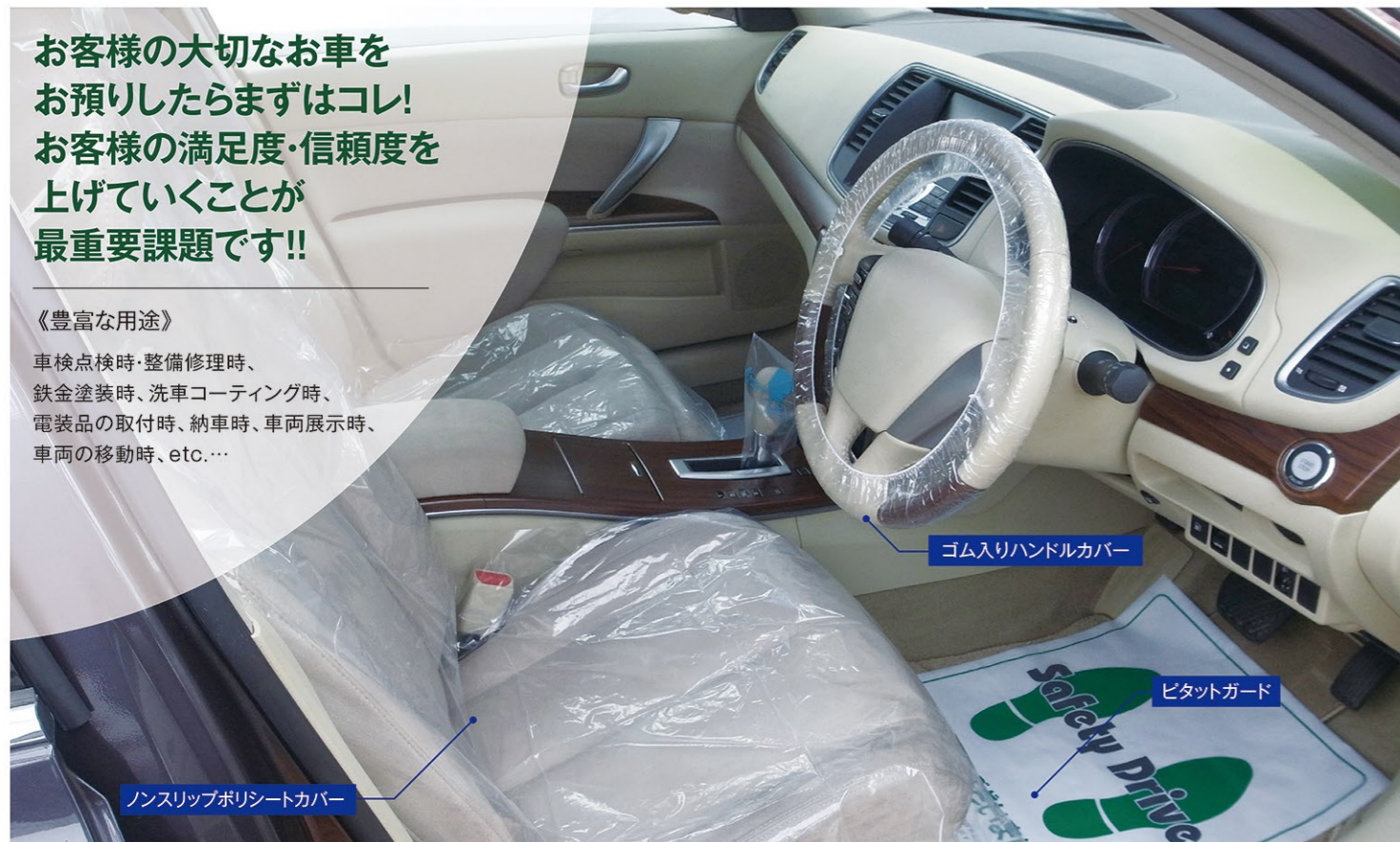
ゴム入りハンドルカバー