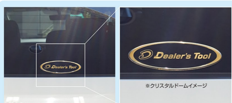
※クリスタルドームイメージ

※ご注意ください/貼りつける場所のホコリ・水分・油分を乾いた布等でしっかり拭き取ってからご使用ください。